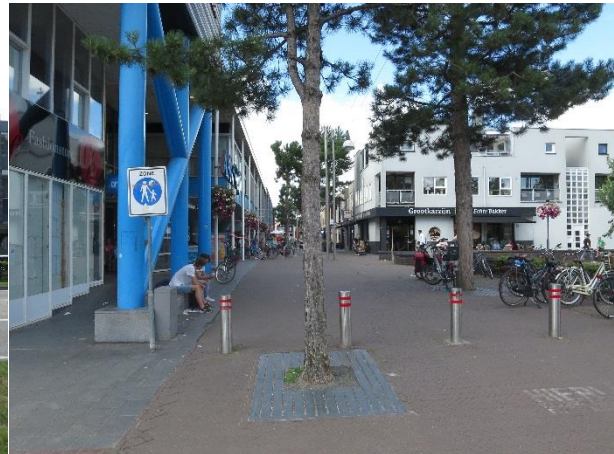
De voetgangersoversteek gaat naadloos over in het fietspad Dalkruid.