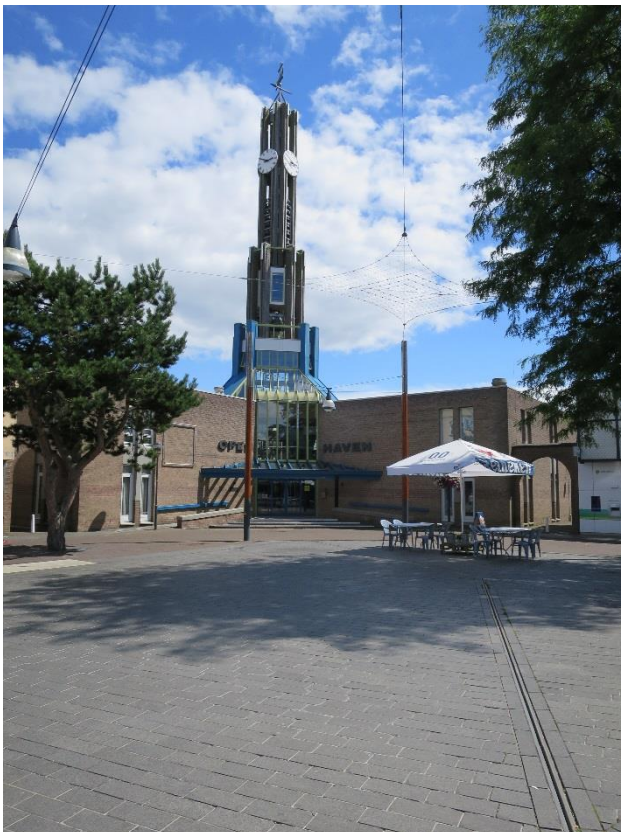
Door Corona is er nu meer horeca op het Kerkplein.