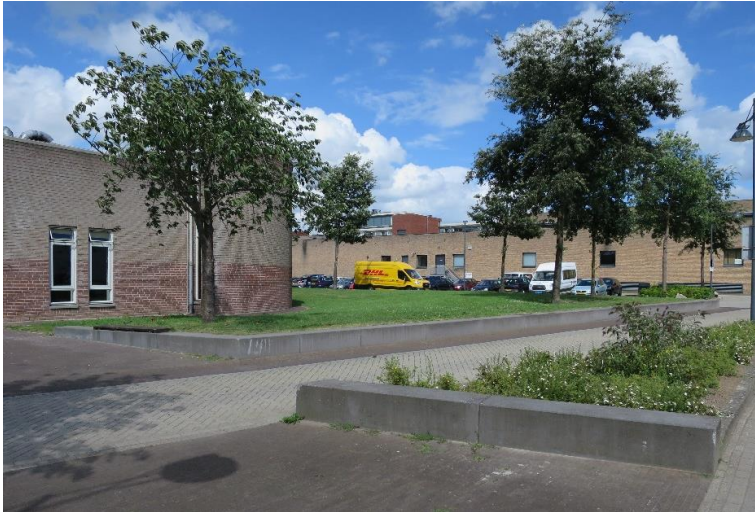
Het groen rond de kerk is wat saai, maar oogt verder keurig.