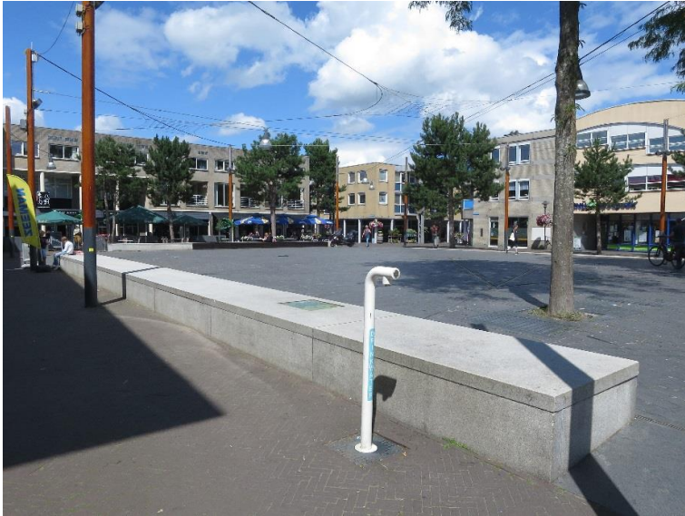
Harde koude betonnen bank, zeker in de winter.