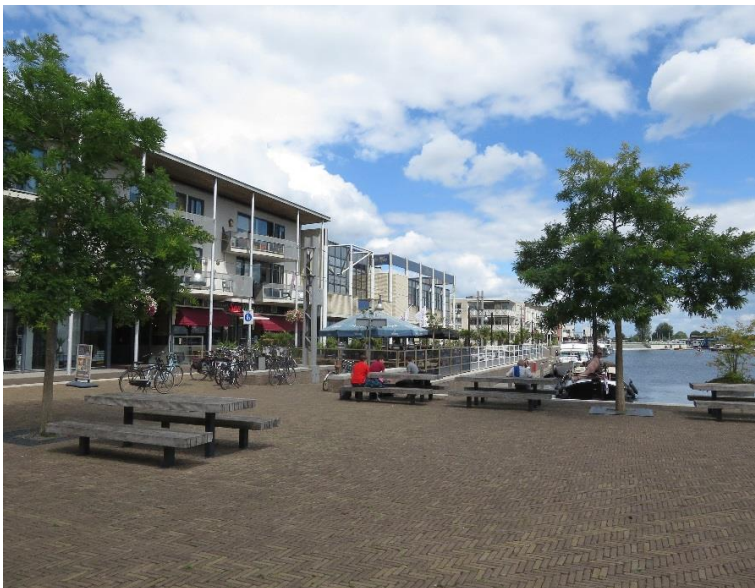
Huidig beeld richting het water.