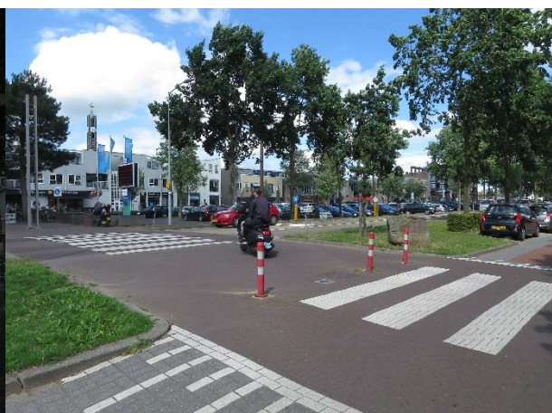
Bij het zebrapad naar het winkelcentrum staan nu vier bordjes met 'fietsers afstappen'