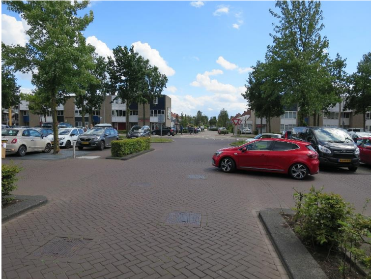
Ontbrekende langzaamverkeerverbinding vanaf Vlaskruid richting winkelgebied.