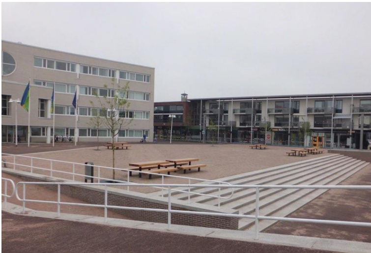
Winters beeld met de nog jonge bomen.