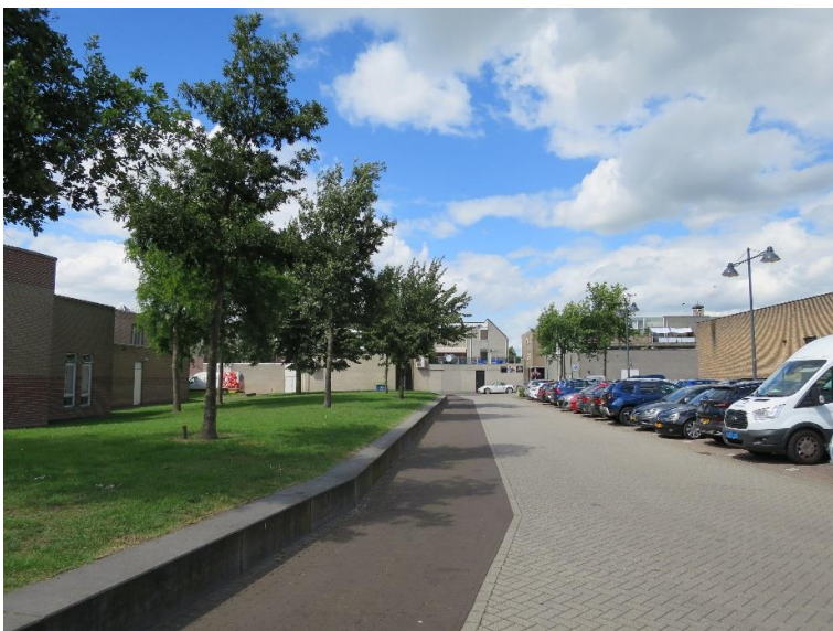
Het binnenterrein is een parkeerplek met kale wanden