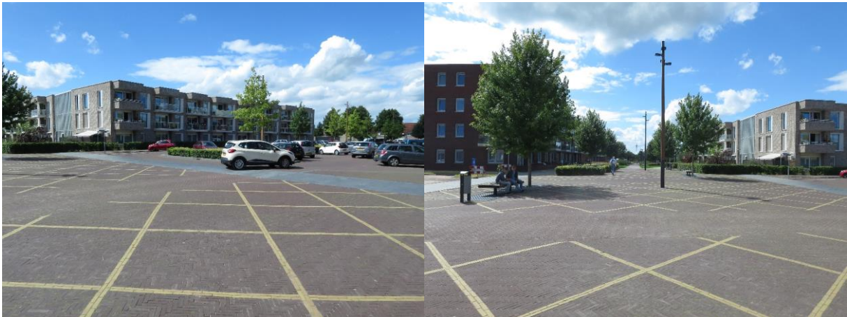
Verwarrende ondergrond voor zowel voetganger als automobilist